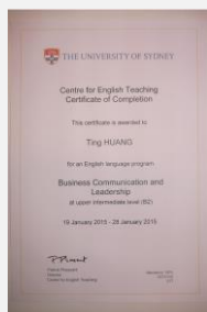
悉尼大学结业证书