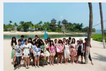
鱼尾狮公园 ( Merlion Park )