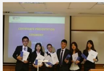
最佳小组获得推荐信